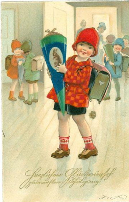
Mädchen mit Schultüte

http://www.ansichtskarten-briefmarken.de