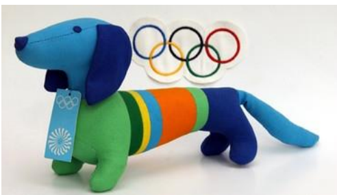
Der „Waldi“ ist das Maskottchen der Olympia-Spiele von 1972 in München

Der Dachshund, auch als Dackel oder Teckel, oder auf Englisch als "sausage dog", Wursthund bekannt, ist nach dem Deutschen Schäferhund der zweitbeliebteste Hund in Deutschland und typisch deutsch. Besonders in Bayern ist er beliebt und populär. Der deutsche Jäger und sein Dackel sind ein Bild, das zu Deutschland gehört wie Weißwurst und Sauerkraut. In den letzten Jahren ist der Dackel aber nicht mehr so beliebt wie er früher war.